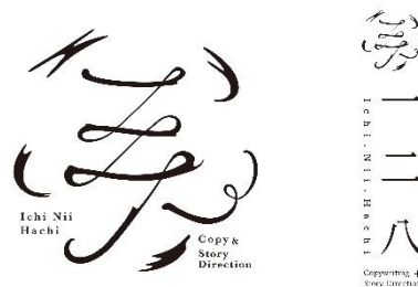
コピーライター—ニハ(イチニーハチ)/ロゴマーク制作

新規事業開発、自社HPやECシステム開発、営業用映像の導入及びものづくりやサービス向上をお考えの企業さまへ。多業種でのブランド企画・開発の実績から、まず何から始めれば?どのように進めて行けば?など、交渉や進行を分かりやすく順序立ててサポートさせていただきます。