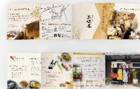
季節料理 三佳屋/8P観音折パンフレット制作