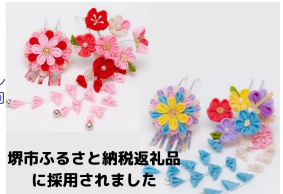
堺市ふるさと納税返礼品 に採用されました

また、先日はありがたい事に手作りのつまみ細工が堺市ふるさと納税の返礼品に採用され、この11月頃（2022年11月）掲載されます。