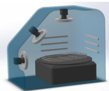
撮像分析装置イメージ図