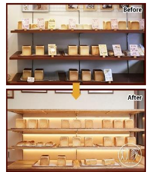
【パン屋さんの棚照明】 上が以前の棚、下が施工後の棚です。 棚はオリジナルで制作しました。 パンを背面から照らすことにより、焼き立ての美味しそうな雰囲気が伝わります。