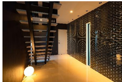
新築社屋エントランス照明