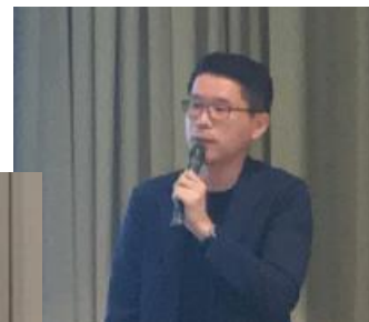
(株)COGウェブサービスの塩路社長