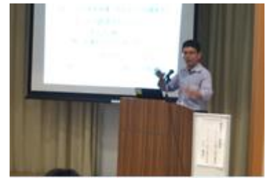
フッ素樹脂などの機能性コーティング剤の開発を行うアートケミカル(株)の中山社長