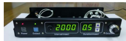
Bi phase (バイフェーズ)