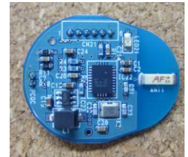
無線付きセンサー基盤

会員様及び入居企業様の技術・製品・サービス等に関するPR情報を募集しています。記事原稿、写真などをEメールにてS-Cubeまでお送りください。皆様のPR情報をお待ちしております。