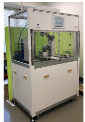
ロボット・SIサービス “ALFIS” (アルフィス)

また、キャスター付きで移動も簡単、家庭用コンセントが使って設置後、すぐに使用することができます。