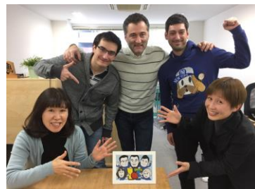
チーム アルドネット

会員様及び入居企業様の技術・製品・サービス等に関するPR情報を募集しています。記事原稿、写真などをEメールにてS-Cubeまでお送りください。皆様のPR情報をお待ちしております。