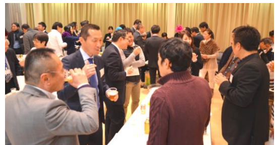
前回の交流会の様子