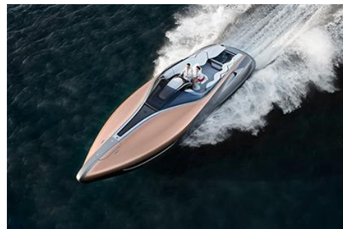
LEXUS Sport Yacht Concept