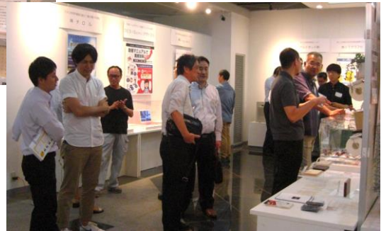
IPCギャラリー展示プレゼン・商談風景