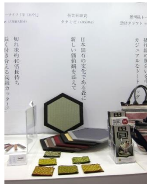
猫専用置き畳(六角形の畳)と畳べりを活用した「小銭入れ」