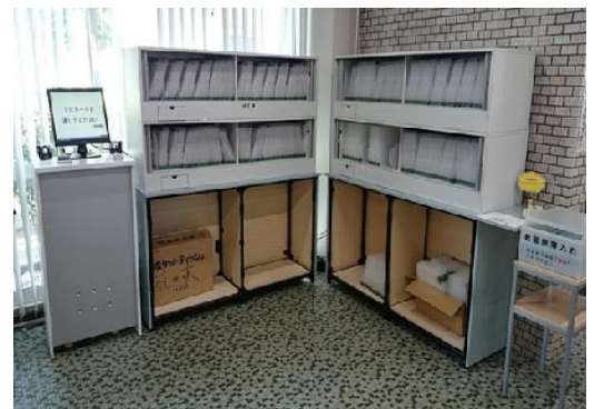
物品検索システム 上: 横型 右: 縦型