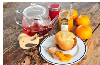
有田の木成完熟みかんマーメイド

「果実ひと筋130年 フルーツで豊かなライフスタイルを提供したい」 1887年に大阪木津で「カネテ」の屋号で創業し、四代に渡りフルーツの販売を続けてきました。 ライフスタイルの変化によって、フルーツを生で食べる以外の楽しみ方をもっと提供していかなくてはならないと感じ、2004年にオリジナルブランド「アトリエ コンフィチュール」を設立。 老舗果物専門店ならではの、産地や品種を絞込んだフルーツを使った無添加ジャムや、ピネガー、ゼリーなどの加工食品の企画開発・製造をスタートしました。 現在では、自社のECサイトや百貨店や生協などへの卸売りを中心に販路を拡大するとともに、添加物をなるべく使わない製法、小ロットでの生産、持ち込み原料の加工ができる点などが評価されて、OEM生産の依頼も増え続けています。 また、OEM商品では、フルーツに限らず、野菜、乳、お茶、花など、広く農産加工のニーズも多いことから、「瓶詰」「菓子」「乳製品」「ソース類」と4つの製造許可を取得し商品開発を行っています。