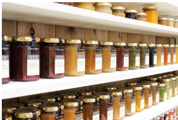
自社加工商品「アトリエ コンフィチュール」