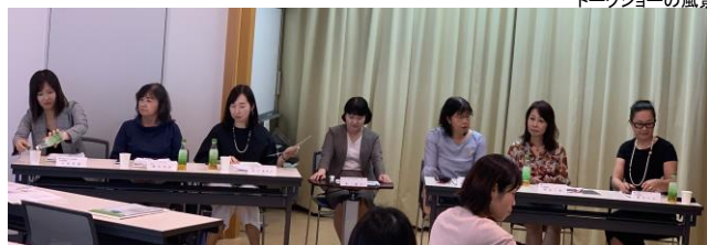
トークショーの風景

※ 関西・医療総合サポートセンターは、10/1付けでオフィス301号室に移転しました。