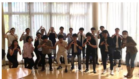
参加者全員でS-Cubeの「S」のポーズで集合写真を撮りました！