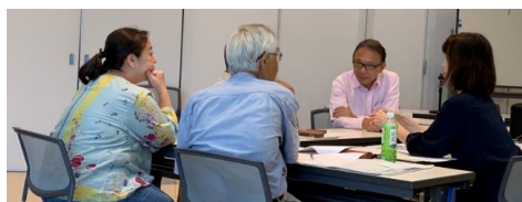
先輩起業家による質疑応答