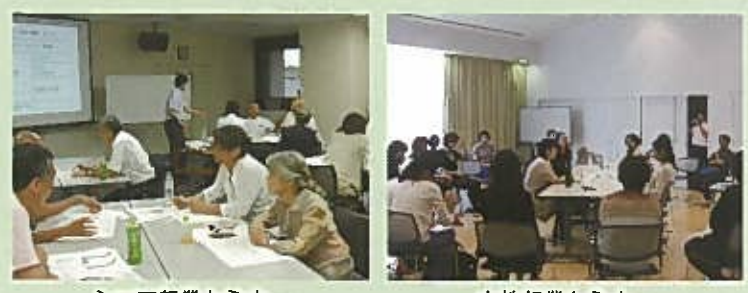
シニア起業セミナー