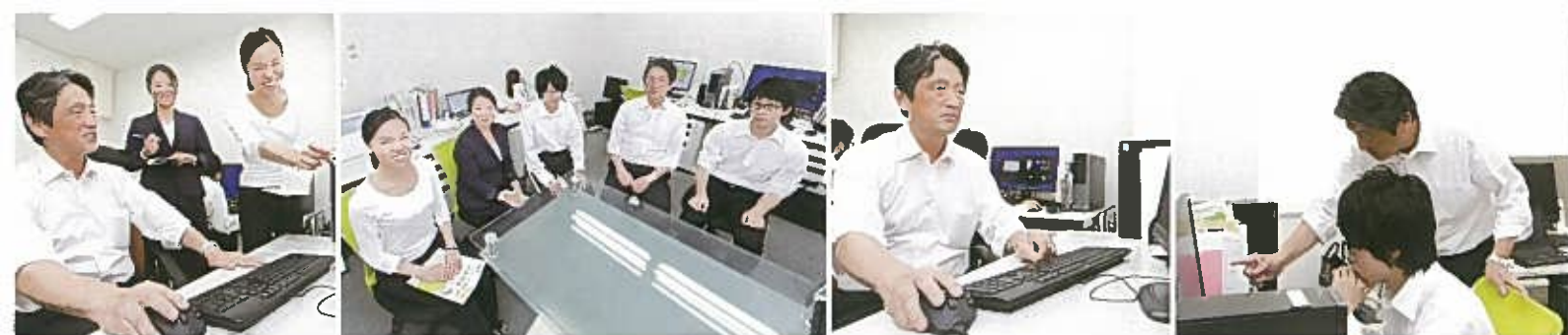
社員時代に培った経験から開発した『たすかるナウ』は多くの大手企業で採用され評判も上々。1人で起業した会社も現在では4人の若いスタッフを抱えるほどに成長した。

起業する前に、自分でどれだけお客様を確保できるかを考えることは大切ですね。あと、資金は起業に必要な金額の2倍を確保してから動き出すこと。最初のチャレンジは自分の思い込みが強く失敗することがあるので、2回目の挑戦に向けての資金も必要だと思います。